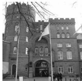
Student Union building AF