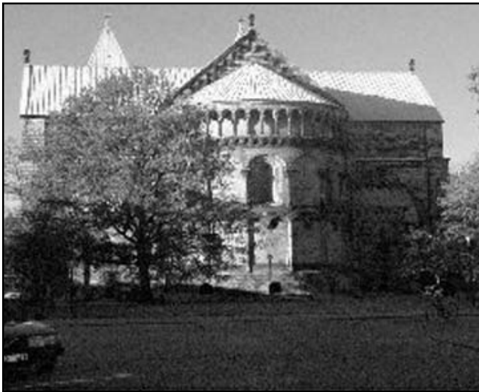
Lund Cathedral's Crypt.